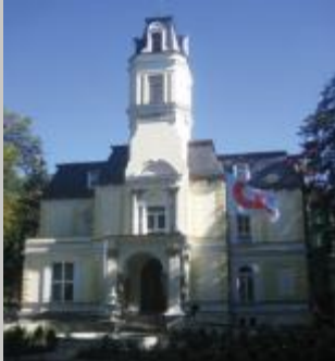
CiS SYSTEMS s.r.o. Hauptsitz Tschechien NOVÉ MĚSTO P.S.