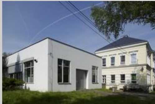
CiS SYSTEMS s.r.o. Werk Tschechien LUDVÍKOV