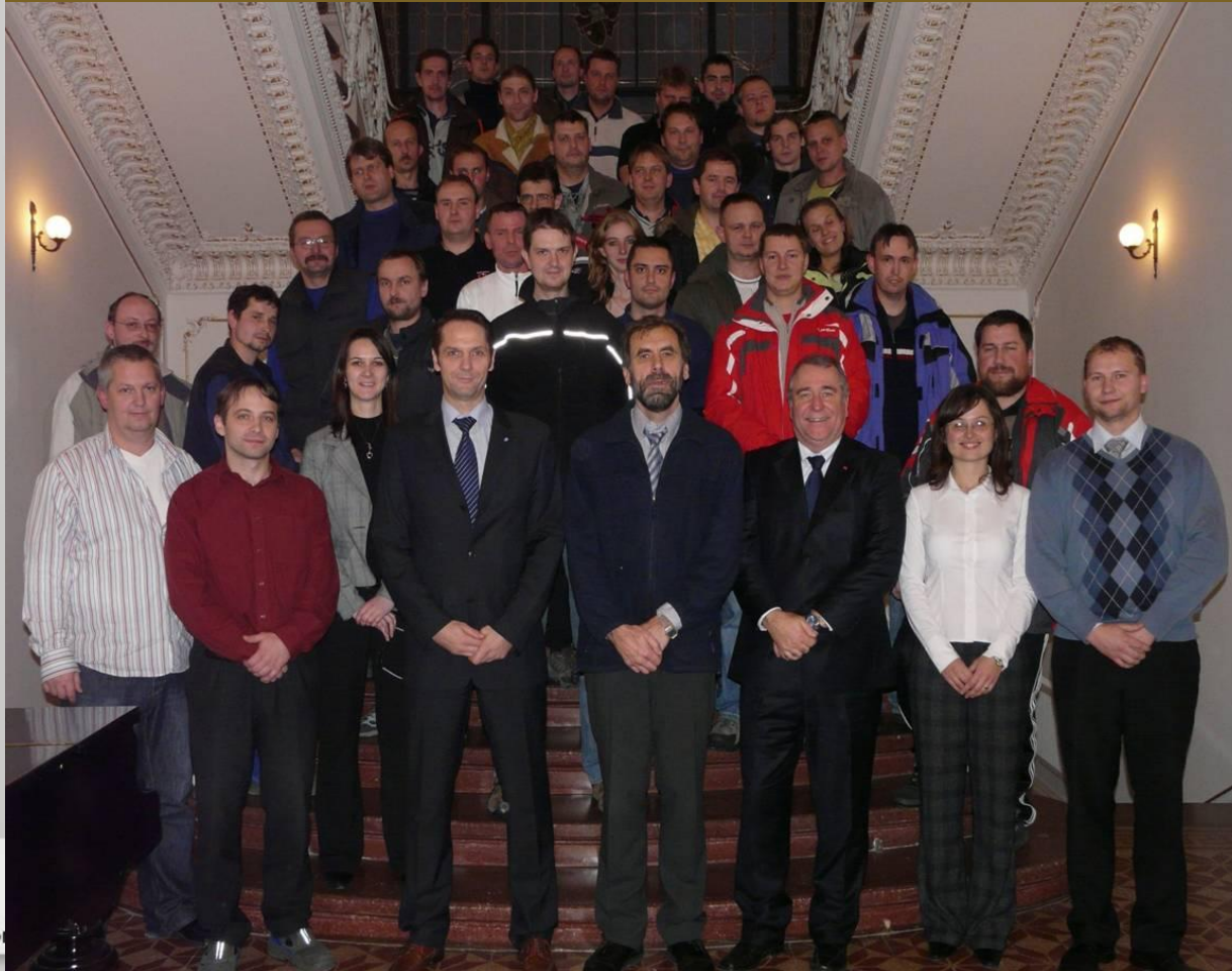
Der Start der 1. Klasse