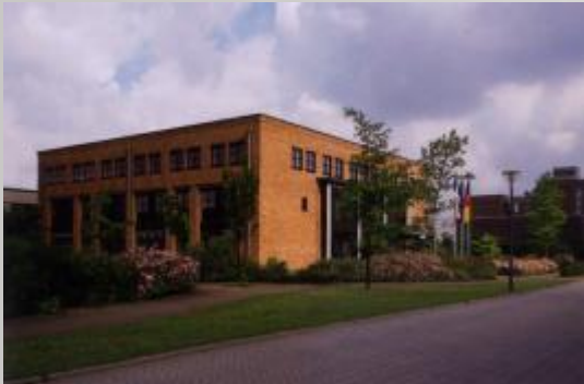
CiS ELECTRONIC GmbH Hauptsitz Deutschland KREFELD