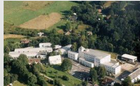
CiS SYSTEMS s.r.o. Werk Tschechien HEJNICE